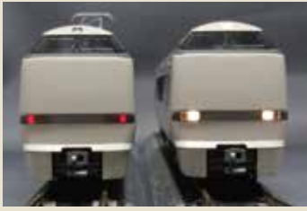
通常の先頭車モードです