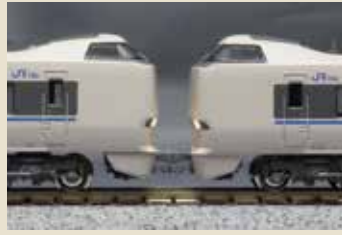
JR西日本で見られる中間先頭車のライト点灯も再現できます