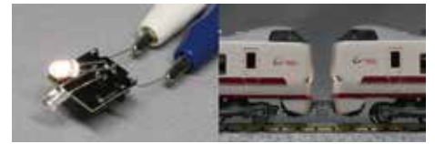
K-57 電球色B 2,200円

主な対応車種 221系(リニューアル), 223系(1000番台を除く), 223系100番台・5100番台, 227系, 521系, 115系300番台岡山117系, 273系, 287系, 289系(このとりのきさき) 381系, 683系8000番台など