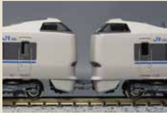
もちろんオフ(消灯)も再現できます