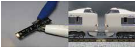
K-53 電球色A 2,200円

主な対応車種 683系(8000番台, 10-482-483を除く), 283系, 289系(くろしお) など ※283系で使用する場合は、テールライトのレンズをクリアレッドに塗ってください。