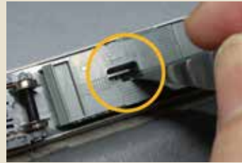
床下の切替スイッチでモードの切り替えができます